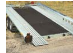
PACM met vloerplaat