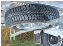
Reservewiel met steun