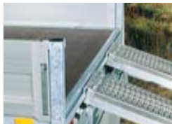
PA met borden/ oprijplaten in aluminium