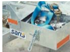
PACM standaard met handige bergruimte