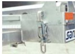
Dubbele vergrendeling op PACM